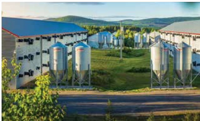
Quartier Saint-François | Ferme avicole, Groupe Westco inc.