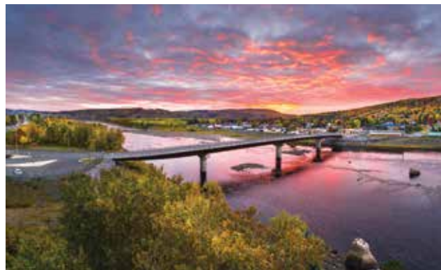
Quartier Clair | Pont international reliant Clair, N.-B. et Fort Kent (Maine)

Quartier Clair – L'ancien village de Clair est le pittoresque carrefour des activités sociales et économiques du Haut-Madawaska, en bordure du majestueux fleuve Saint-Jean. Le village est relié à la localité américaine de Fort Kent (Maine) par un pont international. Visitez l'église catholique de l'endroit, qui renferme des oeuvres réputées d'art religieux : vitraux par José Osterrath et le Chemin de croix du célèbre céramiste québécois Jordi Bonet. L'industrie forestière est la base de l'activité économique locale.