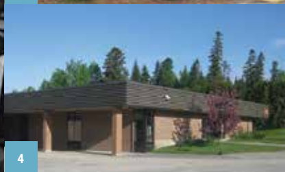
1. Visite scolaire au Musée de la forge Joe B. Michaud | 2. Interprétation au Site historique de Clair 3. Bibliothèque Mgr-Plourde | 4. École communautaire Ernest-Lang