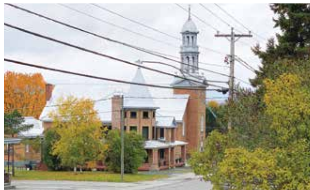
Quartier Saint-Hilaire | Église et ancien presbytère