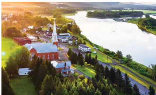
Quartier Baker-Brook | Vue panoramique du centre du quartier

Quartier Baker-Brook – L'ancien village de Baker-Brook est considéré comme le berceau de la légendaire République du Madawaska, dont l'histoire bouillonnante a marqué la région à jamais. En 1827, John Baker, colonel dans l'armée américaine, a laissé son empreinte dans la p'tite histoire du Madawaska en contestant la délimitation des frontières. Il y a hissé le drapeau américain de l'époque, en proclamant cette portion du territoire « République américaine du Madawaska ». Les autorités gouvernantes l'ont accusé de trahison et l'ont emprisonné. Une série d'évènements subséquents a mené à la délimitation des frontières actuelles en vertu du traité Webster-Ashburton de 1842.