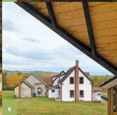
1. Ledges, Place des Pionniers | 2. Église de Baker-Brook | 3. Pont couvert, Ruisseau Baker 4. Site historique de Clair | 5. Maison ancestrale | 6. Complexe Maxime-Albert