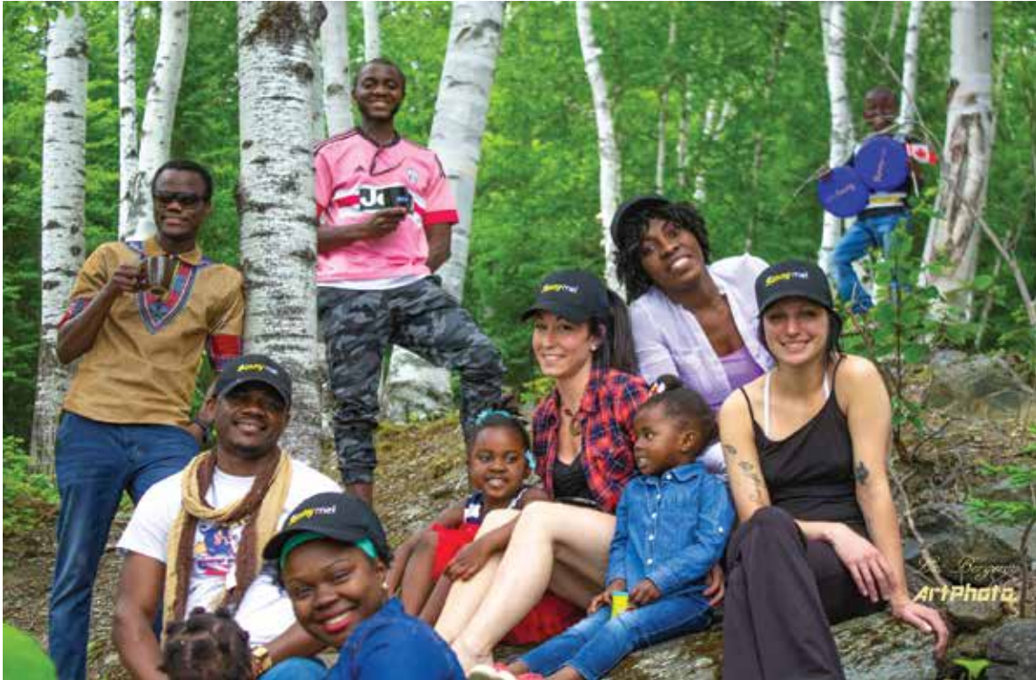
Nouveaux arrivants, région de Haut-Madawaska

La Communauté de Haut-Madawaska est partenaire du gouvernement fédéral et de sa stratégie en matière d'immigration francophone et a été désignée comme Communauté francophone accueillante.